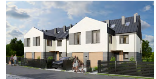
Widok od strony ulicy