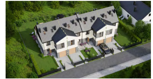
Widok budynku z lotu ptaka

Kilka rozwiązań aranżacyjnych dla każdej kondygnacji